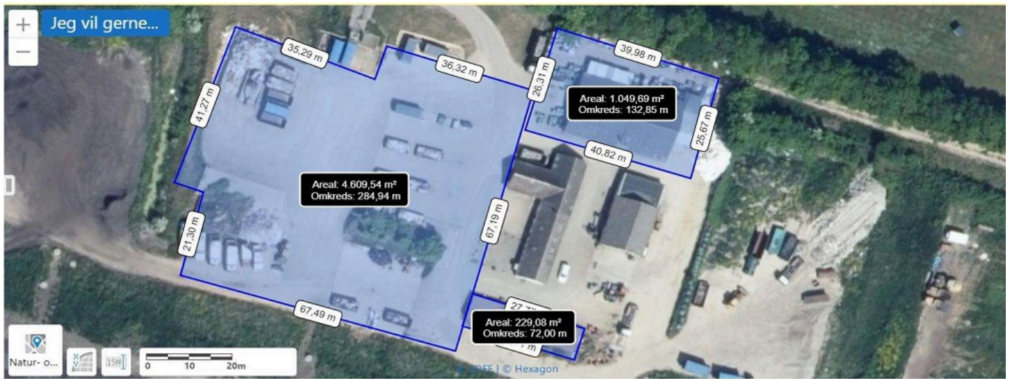
Billede 2: Forslag til indretning af genbrugsplads.